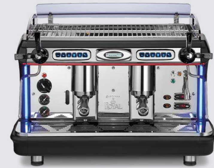
2 groups TCI Electronic model

Side lights - Upper front lights Standlicht - Vorder licht top Lumiere laterales - Lumiere anterieures Luz lateral - Luz frontales