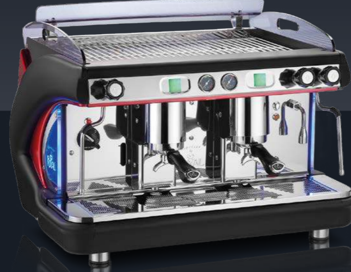
2 groups - black and red Switch model. Lighted switch