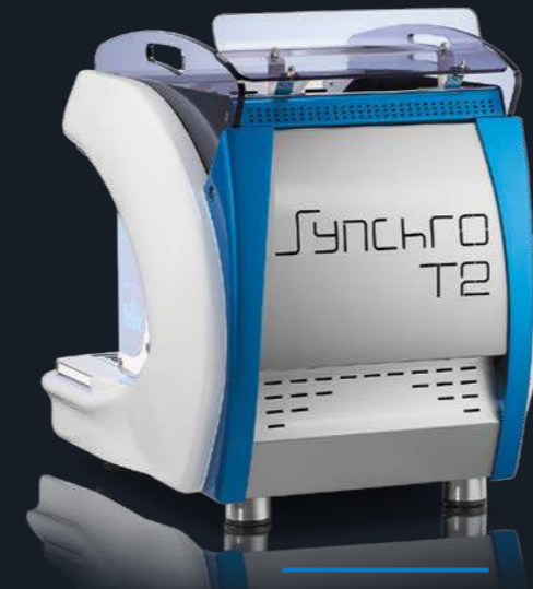
1 group - white and blue