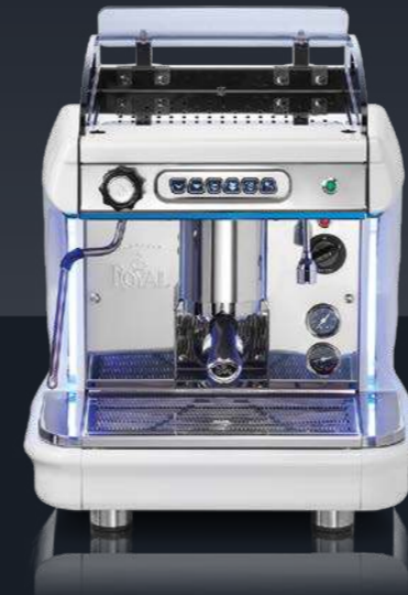
1 group - white and blue Electronic model