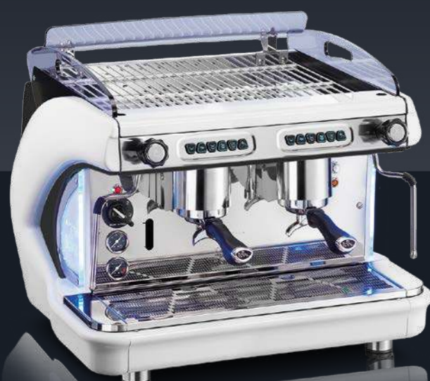
2 groups SB - white and black Electronic model