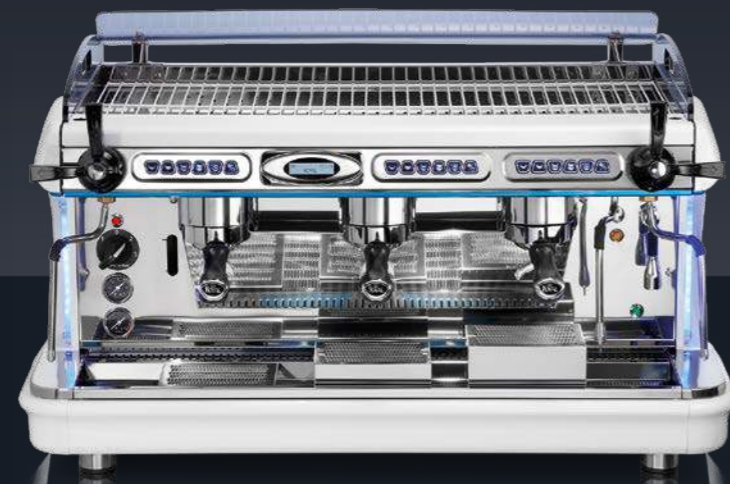
3 groups - white and blue Electronic model