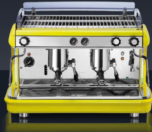
2 groups - yellow and white Lever dispensing