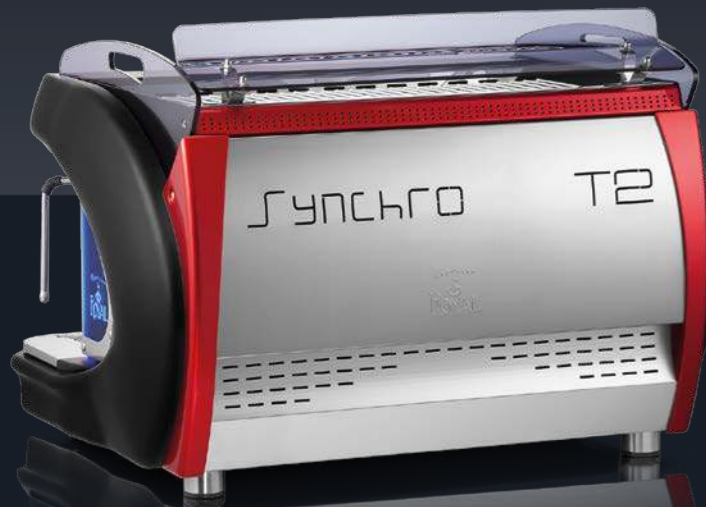
2 groups - black and red

* Groups type: trad. (4,4 kg) = tradizionale / traditional / traditionnels / traditionelle / tradicionales Groups type: stan. (1,5 kg) = standard / standard / standard / standard / standard